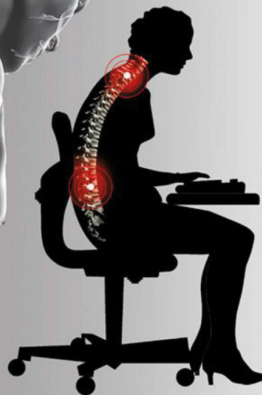
nesprávné držení těla při sezení způsobuje bolesti v zádech