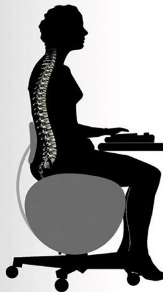
správné držení těla při sezení na balonové židli