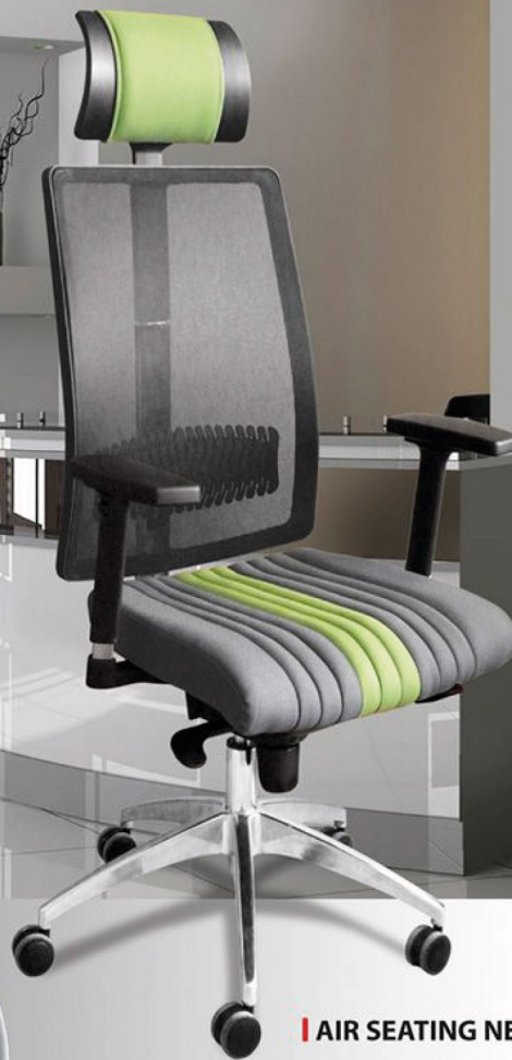
AIR SEATING NET